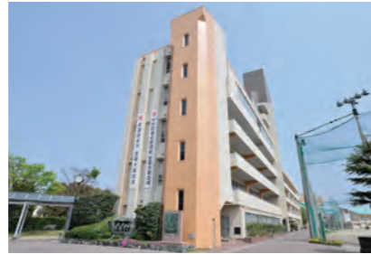
生光学園高等学校