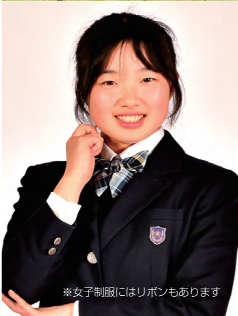
※女子制服にはリボンもあります